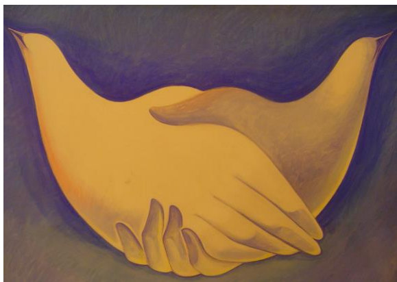
Qu'entendons-nous lorsque nous disons : "Je crois en l'Esprit saint...la sainte Eglise universelle (ou catholique)" ?

Dans quelle mesure les Eglises ont-elles besoin les unes des autres pour mieux discerner la mission du Christ, cœur de leur communion ? Comment sont-elles ouvertes aux dons que Dieu a mis dans les autres Eglises ? Intègrent-elles l'apport des autres Eglises dans leur théologie et leurs décisions ? Que comprenons-nous lorsque nous disons : "Nous croyons l'Eglise universelle (ou catholique)" ? Poser ces questions, c'est poser celle de la catholicité.