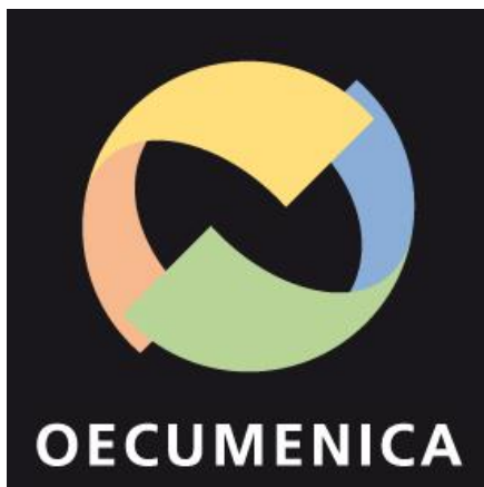
Le "Label œcuménique" a été donné au CECCV pour l'expérience des Célébrations de la Parole.

Impressionnante participation de la Communauté catholique de langue portugaise à la célébration de janvier. Cet "honneur" de venir prier à la cathédrale a en effet attiré la foule. Elle a été suivie par l'Eglise orthodoxe érythréenne, qui a aussi rassemblé une nombreuse assemblée, non seulement de membres de cette nouvelle Eglise à Lausanne, mais aussi d'autres confessions, venus découvrir sa spiritualité. Les vêpres de l'Eglise orthodoxe, préparées par les responsables des quatre patriarcats, furent offertes au mois de mai, pour la joie de tous les sens. Une belle expression d'un œcuménisme à l'intérieur d'une même Eglise!