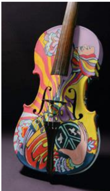
Le thème de la semaine des religions en 2009 : la musique dans les différentes communautés

Un texte sera soumis aux Eglises membres en 2010, qui devrait aider les Eglises à exercer un discernement dans ce domaine.