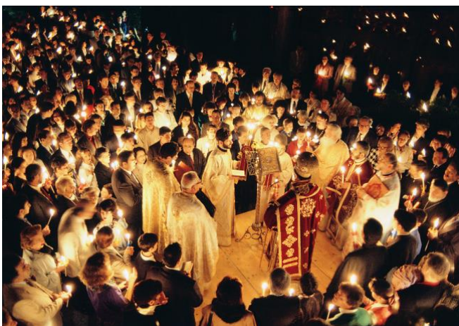
Célébration de Pâques dans l'Eglise orthodoxe.

Lors du Rassemblement œcuménique européen, la délégation suisse avait proposé que Pâques soit l'occasion de célébrations communes lorsque les dates occidentale et orientale coïncident. Cela sera le cas en 2010, 2011 et 2014. La CTECH encourage toute initiative dans ce sens. Une brochure a été préparée sur le sens de la date de Pâque. (Disponible sur www.agck.ch ). Pour l'année 2010, nous prévoyons de publier une plaquette pour inviter les Eglises à se visiter durant la semaine sainte.