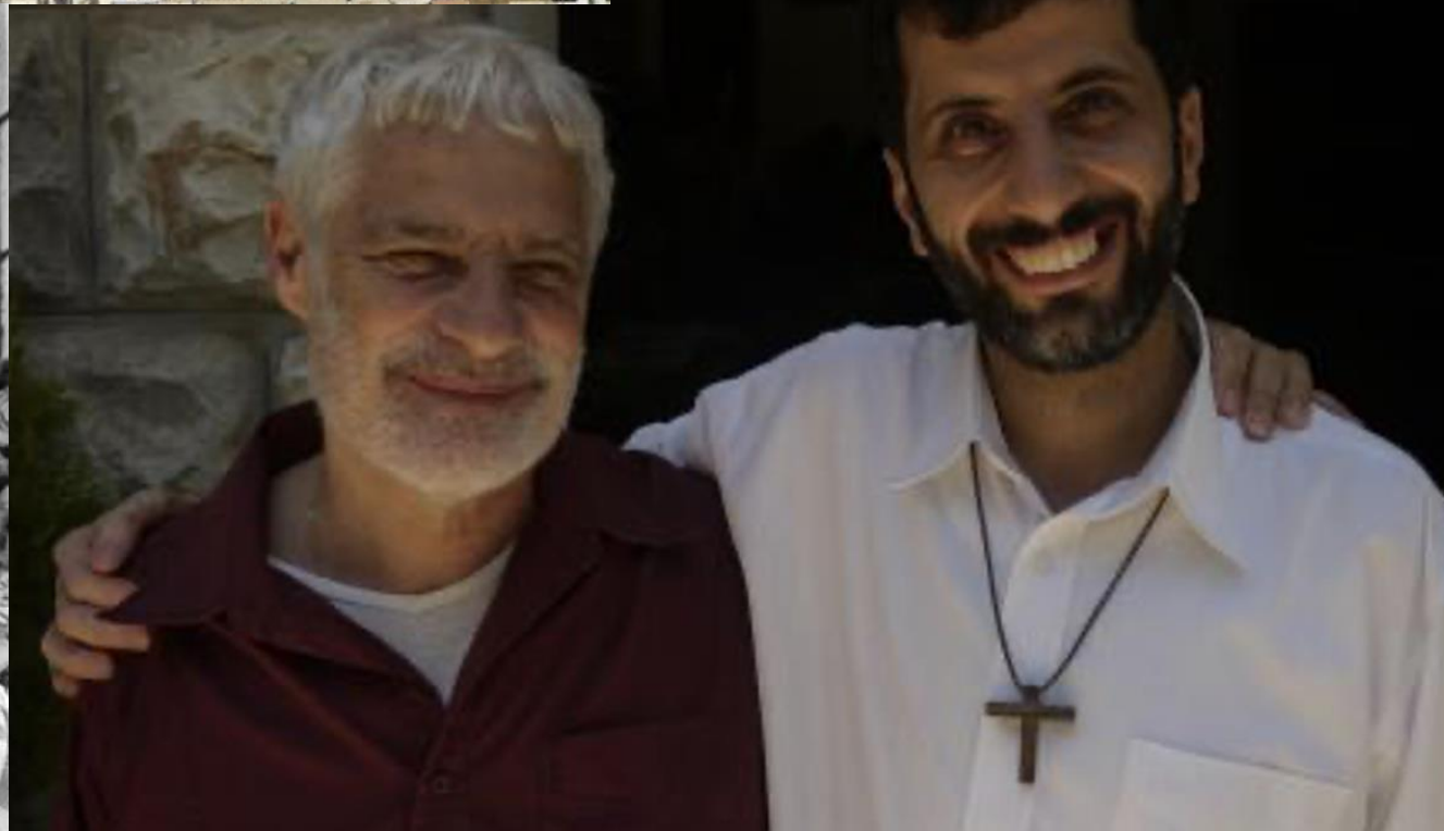
Strasbourg 1982, Renouveau charismatique