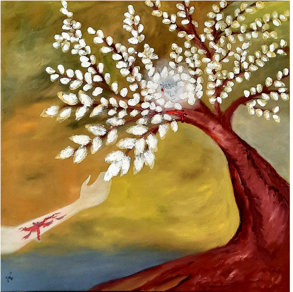
L'arbre de vie : guérison des nations