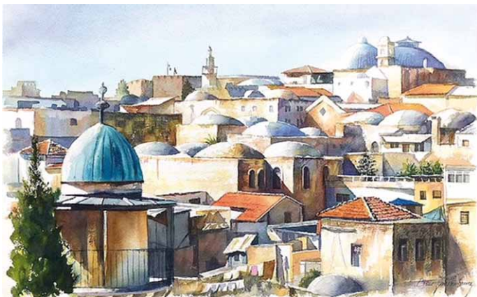
Aquarelles de Beni Gassenbauer, Jérusalem